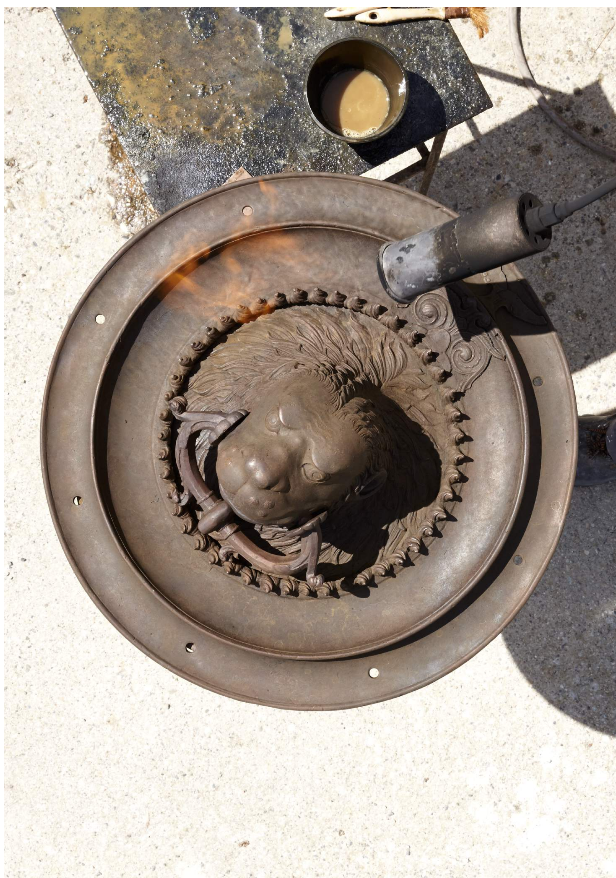
11. LA PATINE À CHAUD AU NITRATE DE FER ET SULFURE DE POTASSIUM