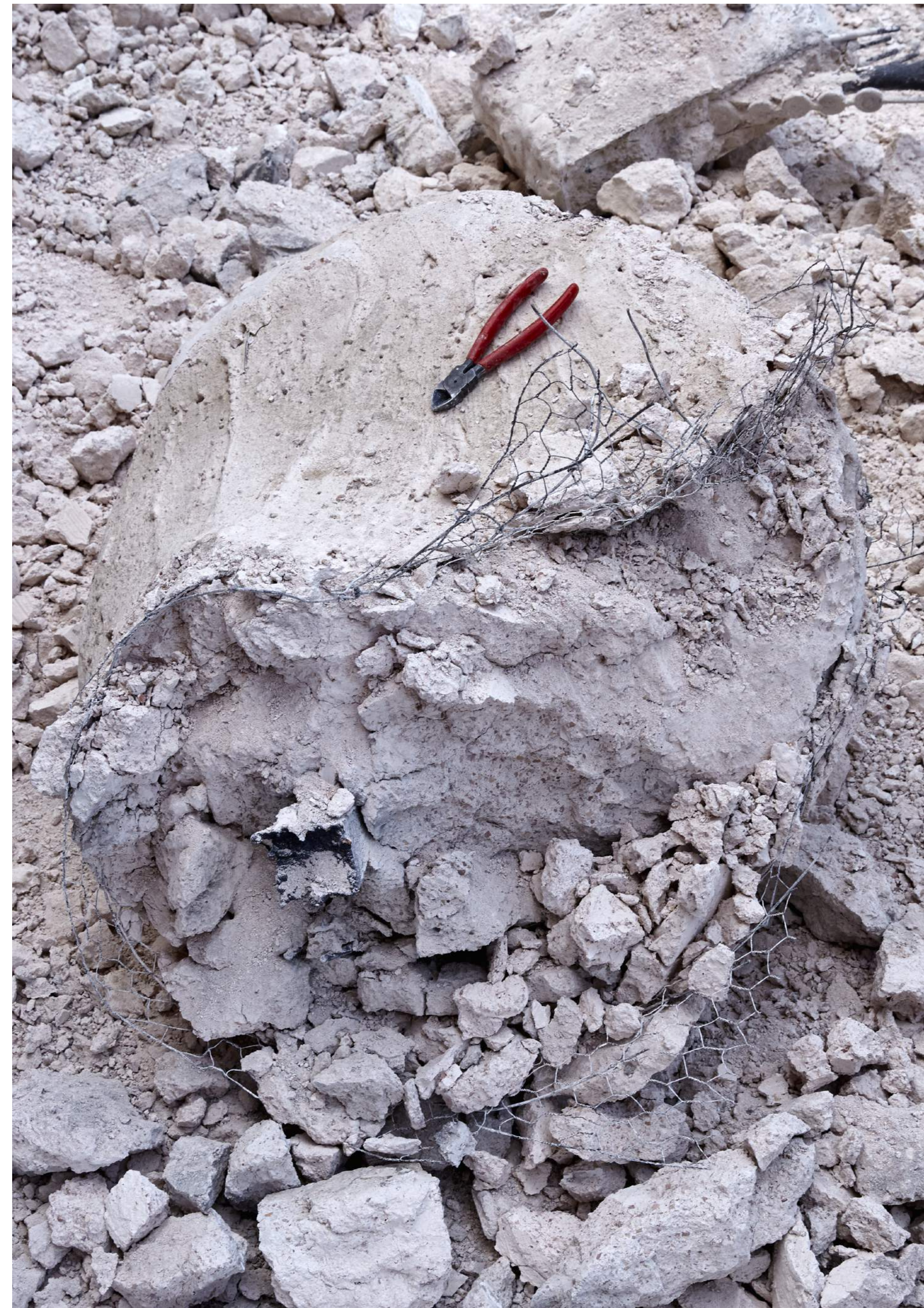
8. DÉMOULAGE GROSSIER À LA MASSE