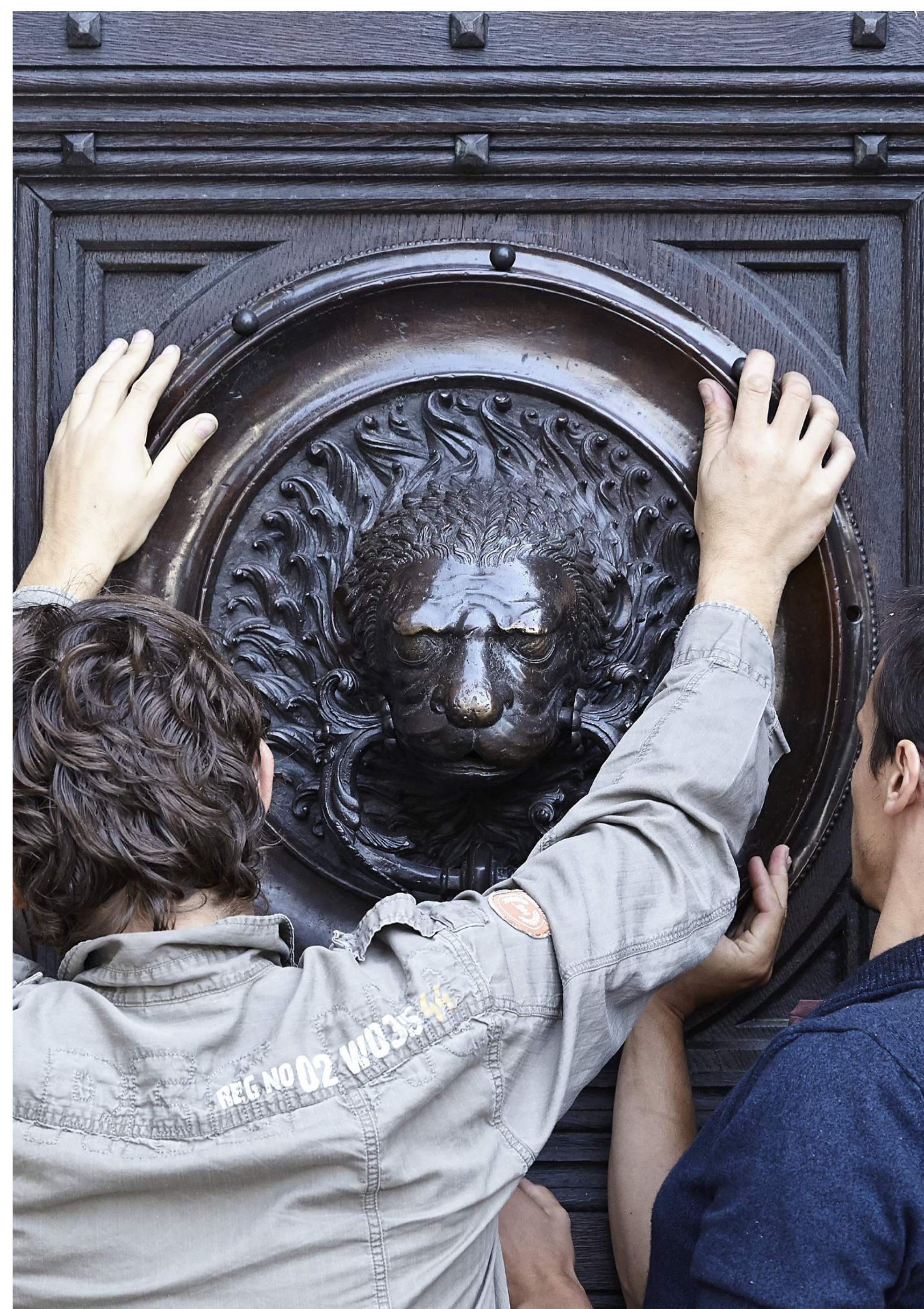
12. LA POSE