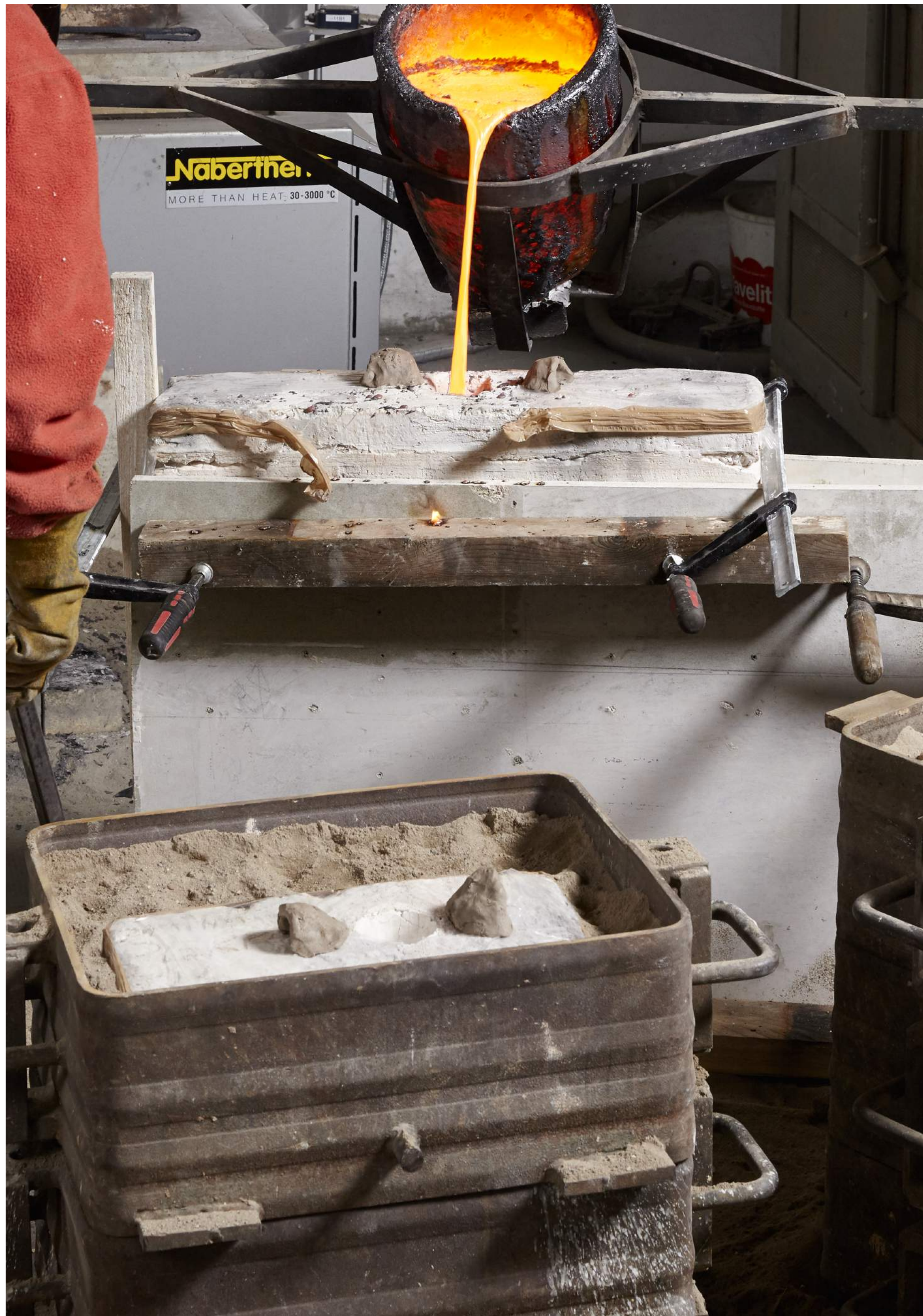
7. COULAGE DU BRONZE DANS LE MOULE RÉFRACTAIRE

Travail de la Fonderie Geya à Ogens. Avril-Août 2017.